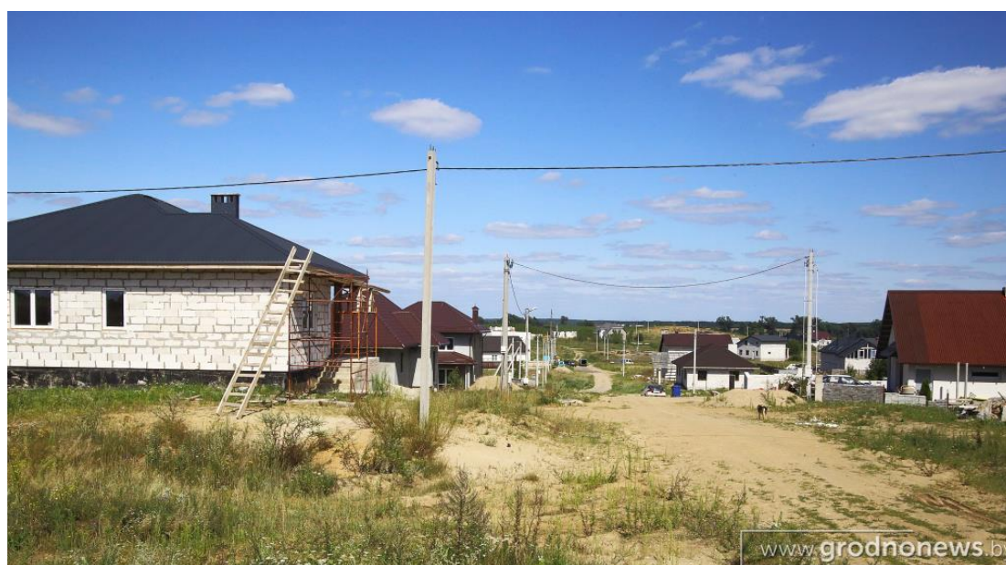
Микрорайон Заболоть-3. Гродно. Частная застройка.