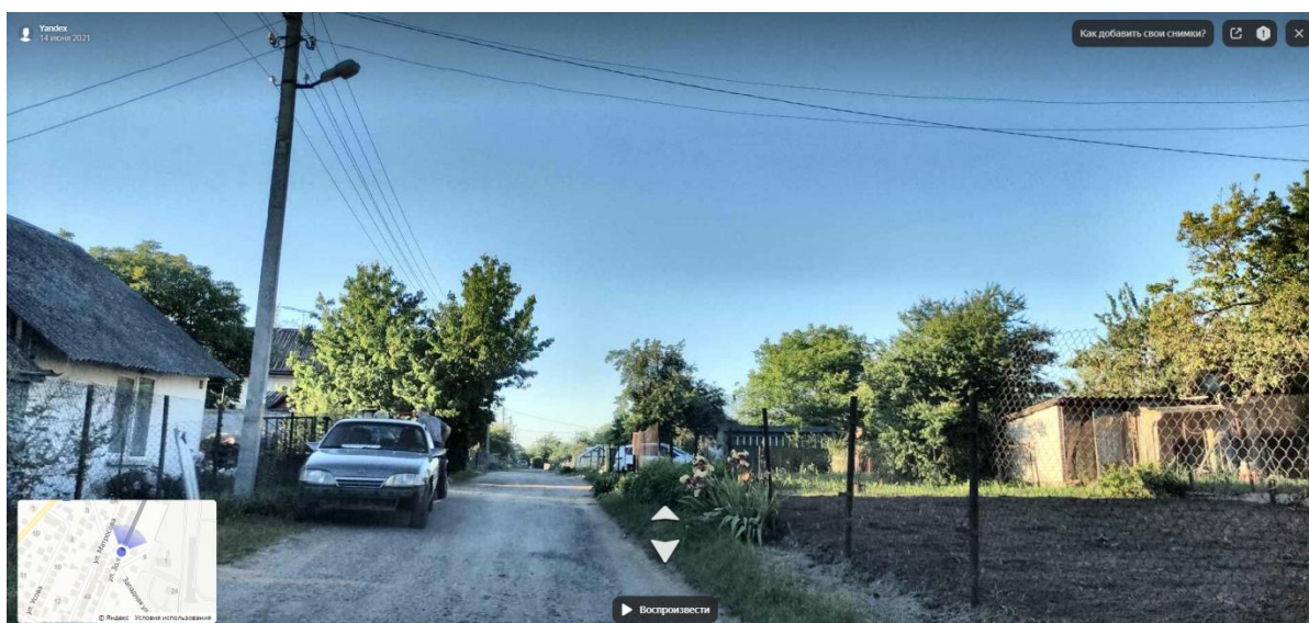
Улица Зои Космодемьянской в Гродно (микрорайон «Палестина»). Неасфальтирована, с домами частной застройки.